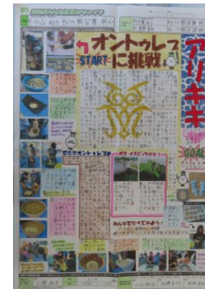
新聞グランプリ出展作品